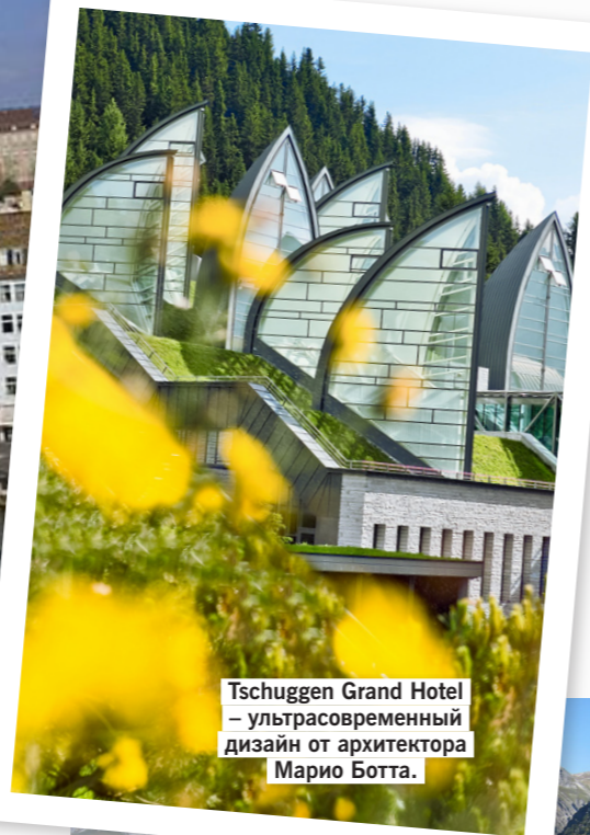
Tschuggen Grand Hotel – ультрасовременный дизайн от архитектора Марио Ботта.

5 Напоследок купить настоящий швейцарский шоколад, например, в магазинах Sprungli. Прямо на твоих глазах шоколатье готовят лакомства разных форм и с разными наполнителями. О вкусах и спорить не надо – каждый вид шоколада по-своему