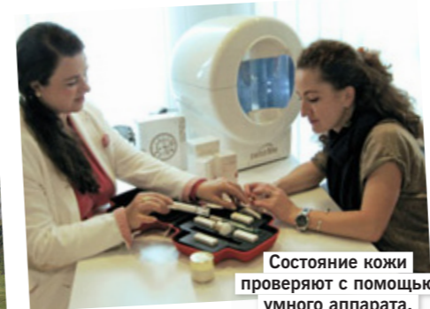
Состояние кожи проверяют с помощью умного аппарата, на фото он за мной.